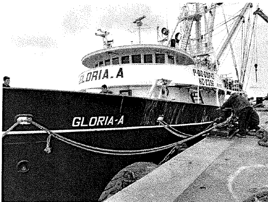
FOTOGRAFIA N° 01: Embarcación de cerco de bandera extranjera (Ecuatoriana) GLORIA A (P-00-00743), acoderada en el muelle centenario de Pesquera Diamante S.A. – Callao, la cual fue intervenida por los fiscalizadores de la DGSFS-PA, por incumplimiento de la normativa pesquera vigente.