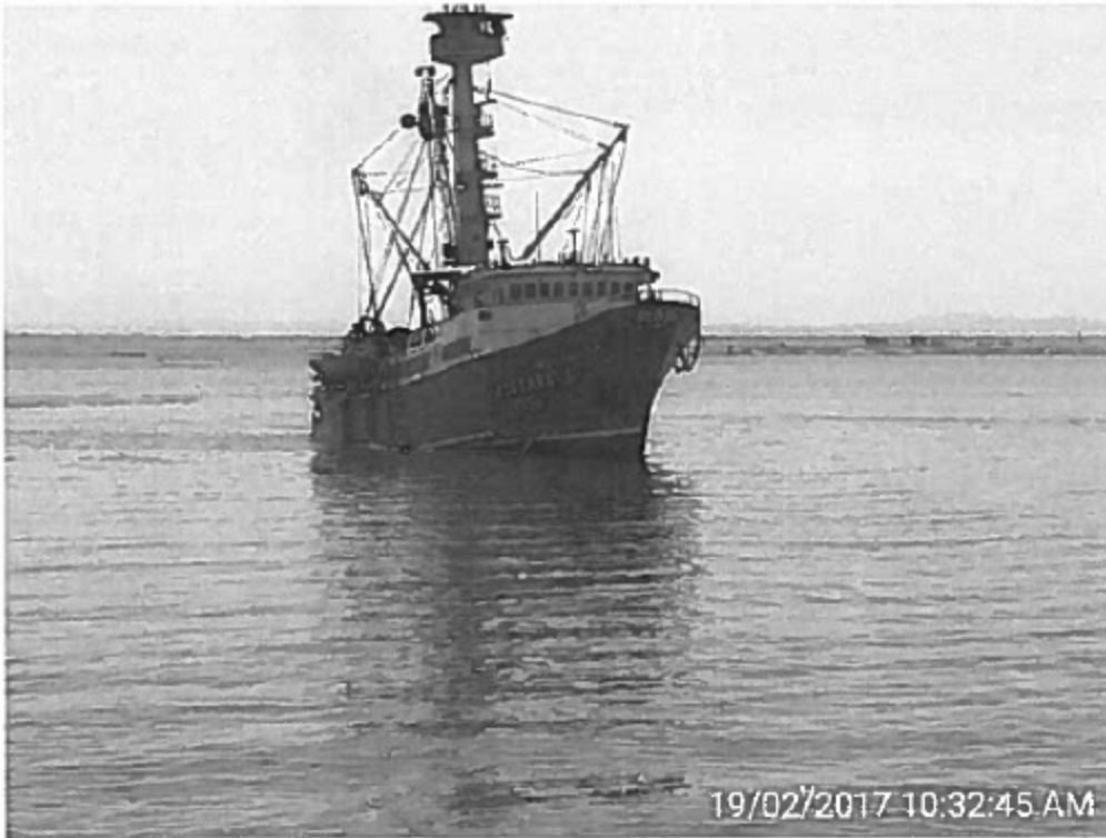
Foto 1. E/P ROSSANA L, intervenida por DICAPI arribando al muelle.