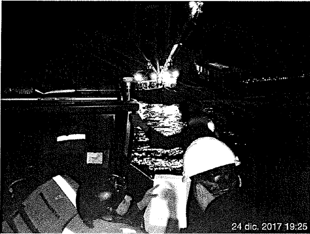
FOTOGRAFIA N° 01. Traslado de los inspectores de la Dirección General de Supervisión, Fiscalización y Sanción del Ministerio de la Producción (DGSEFPA), por parte de personal de la Dirección de Capitanías y Guardacostas de la Marina de Guerra del Perú (DICAPI) hacia la embarcación YELISAVA, fondeada en la bahía del Callao.