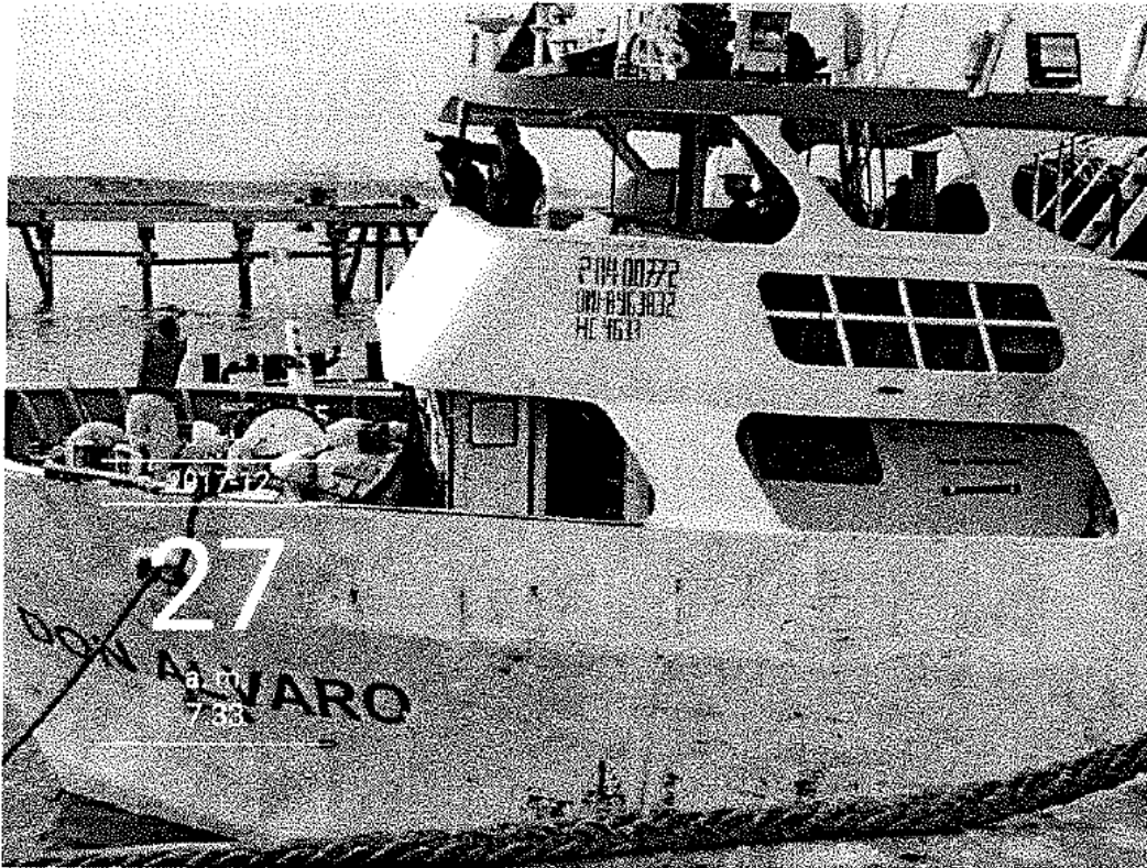
FOTOGRAFIA N° 01: Embarcación Pesquera de bandera ecuatoriana DON ALVARO (P-04-00772), acoderada en el muelle Centenario de Pesquera Diamante S.A. – Callao, la cual fue intervenida por los fiscalizadores de la DGSFS-PA, en incumplimiento de la normativa pesquera vigente.