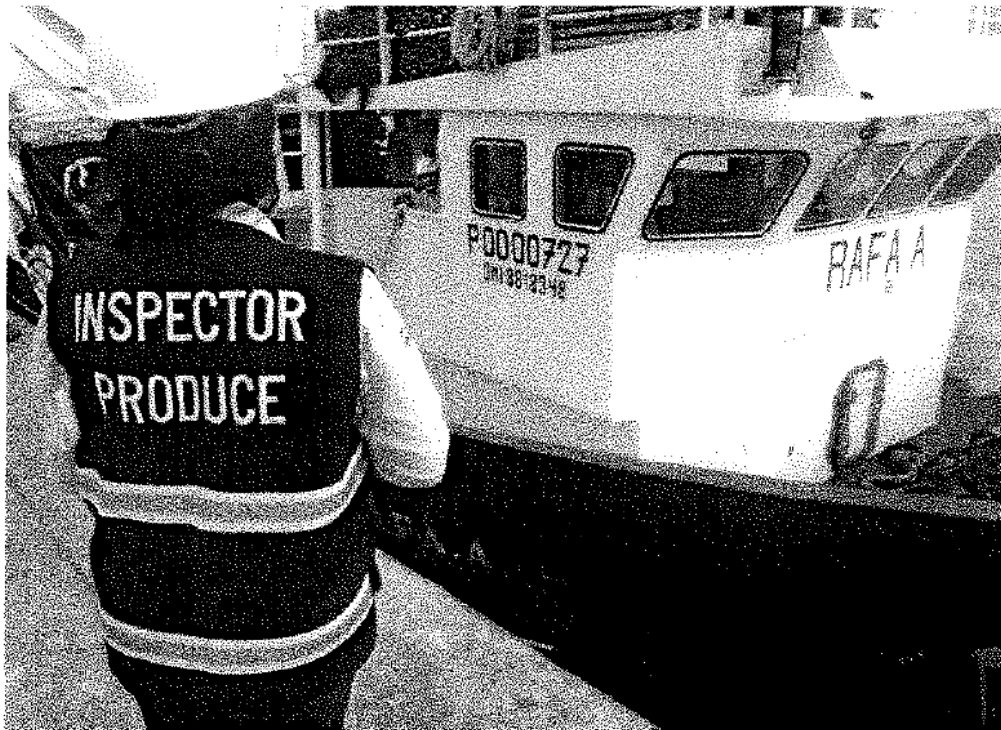
FOTOGRAFIA N° 01: Embarcación de cerco de bandera extranjera (Ecuatoriana) RAFA A (P-00-00727), acoderada en el muelle centenario de Pesquera Diamante S.A. – Callao, la cual fue intervenida por los fiscalizadores de la DGSFS-PA, por incumplimiento de la normativa pesquera vigente.