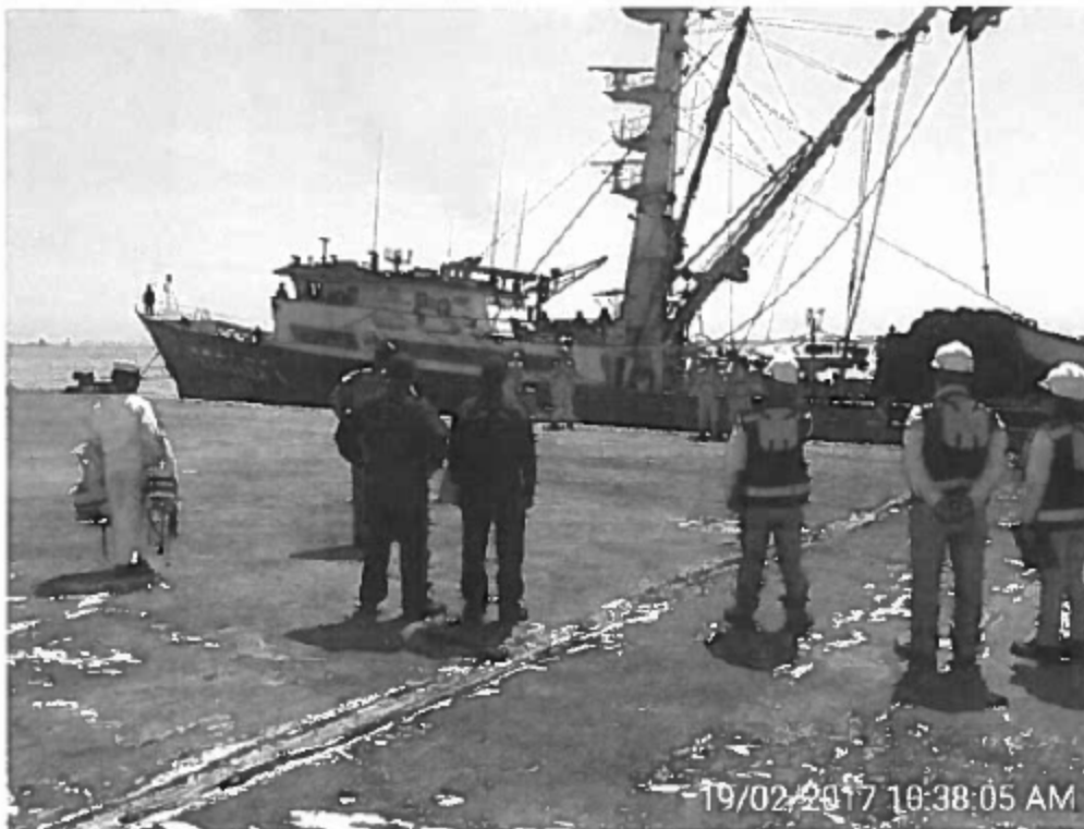
Foto 2. E/P ROSSANA L acoderada en el muelle terminal portuario de paracas S.A.