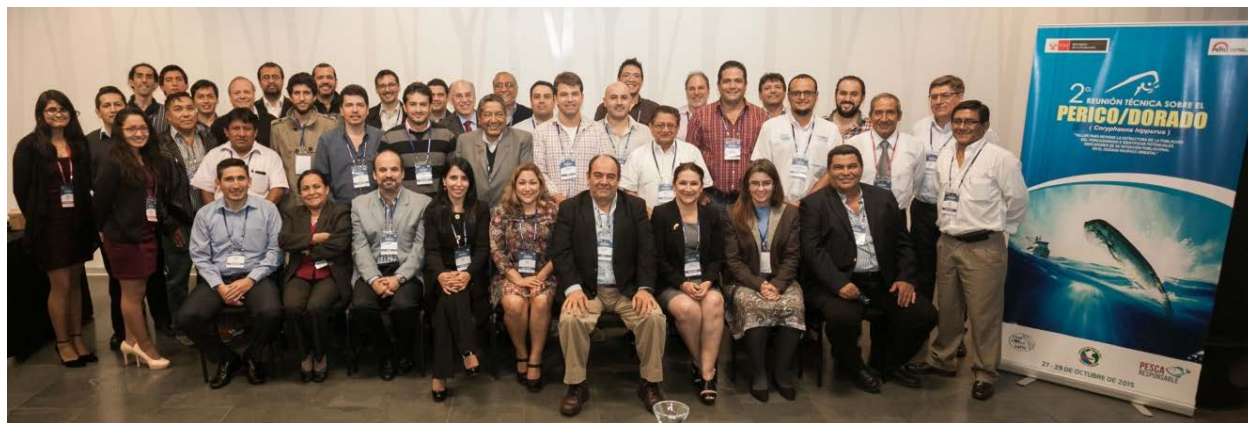
Participantes en la segunda reunión técnica de la CIAT sobre el dorado, Lima, Perú, octubre de 2015. Ver lista de participantes en el Anexo 2.